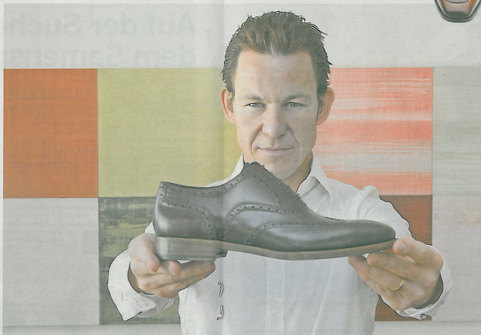
Ein Mann, ein Schuh: Bereits in der dritten Generation beschäftigt