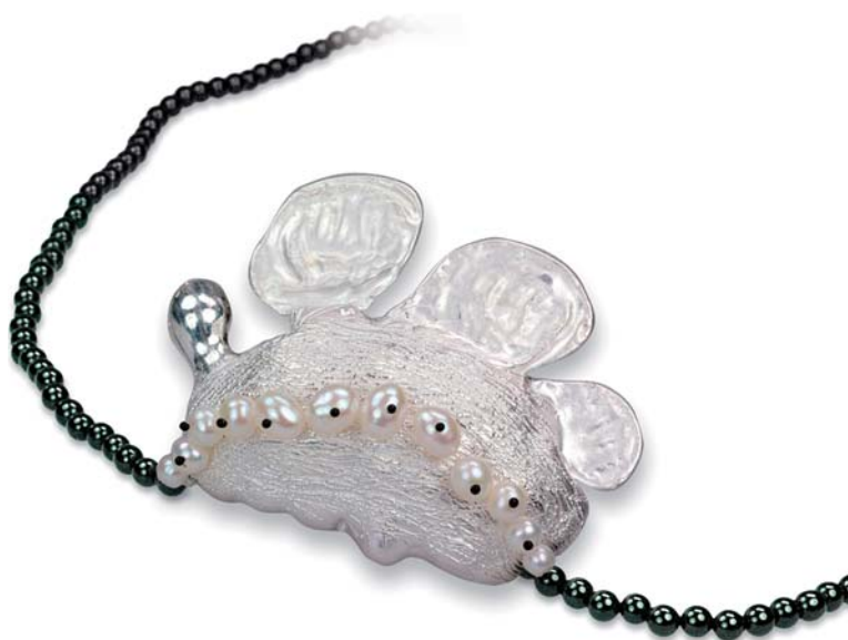
Sam-Tho Duong, Kette mit Ingwer in Silber