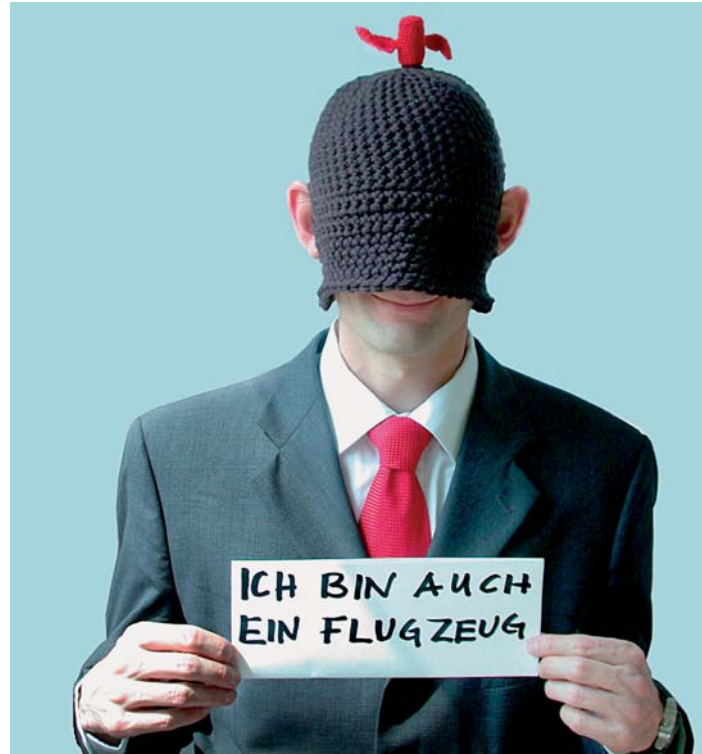
Ich bin auch ein... , Mütze mit Ohrschlitzen und Propeller zum Thema GESICHTSFLÜGEL von Bruna Hauert

Mirabeau hielt 1789 in Paris eine flammende Rede als zornige Reaktion auf die Generalstände, deren Vorsitzender sich auf die alten Gesetze berief, die es dem Dritten Stand verbot, Schmucksachen oder Ringe zu tragen oder ihre Kleider zu schmücken. Das Recht auf Schmuck verband sich mit dem neuen Selbstbewusstsein des Bürgertums. Die Goldschmiede des Biedermeier kombinierten kostbare Rubine mit relativ günstigen Achaten, Türkisen oder Korallen. Sicherlich war das als Folge der Verarmung nach den Napoleonischen Kriegen anzusehen, dennoch beruhte der Materialmix keineswegs auf Bescheidenheit. Mit der teils verblüffenden Modernität der Stücke versicherte sich der Bürger seiner eigenen Individualität, die den Mangel an Macht und Reichtum auszugleichen hatte. Am prägnantesten drückte sich der Persönlichkeitskult wohl im sentimental Haarschmuck der Romantik aus.