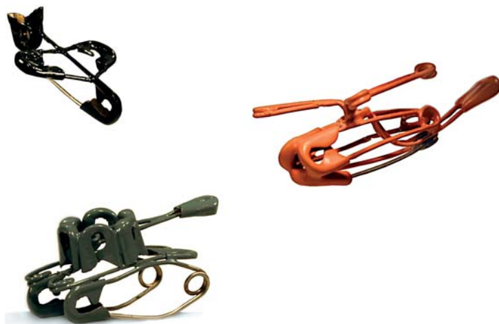
Sicherheitsbroschen, Céline Mazzon; Foto: Bruna Hauert