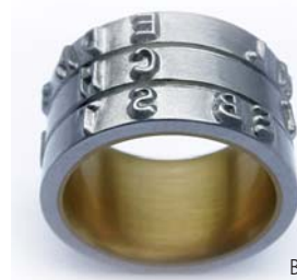
Brillerring von Eva Bruggmann